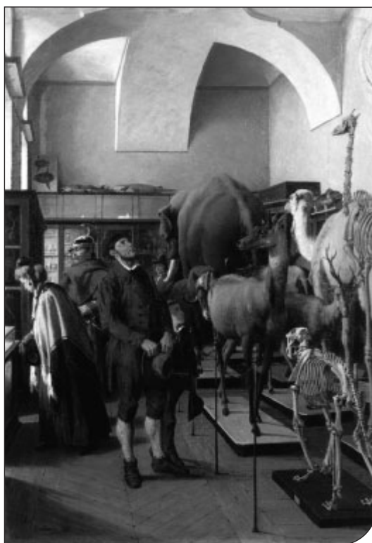
Fig. 2. Lorenzo Delleani, sala del Museo di Storia naturale, 1872, olio su tela, Torino, Galleria Civica d'Arte Moderna e Contemporanea (depositi). Il quadro testimonia l'allestimento della metà del XIX secolo delle collezioni di zoologia al Palazzo dei Regi Musei di Torino. Lorenzo Delleani, room of the Museum of Natural History, 1872, oil on canvas, Turin, Civic Gallery of Modern and Contemporary Art (storerooms). The painting illustrates the mid-19 th century exhibition layout of the zoology collections in the Royal Museums Palace of Turin.

Questa funzione didattica - e più in generale di diffusione di conoscenze scientifiche - dei musei dell'Università di Torino si sviluppa sempre più nel corso dell'Ottocento, quando molte collezioni vengono riunite in un Museo di Storia naturale offerto alla pubblica fruizione prima nel Palazzo dei Regi Musei (fig. 2), nell'ex Collegio dei Nobili dove ha sede anche l'Accademia delle Scienze, poi in Palazzo Carignano. La curiosità suscitata - più di centomila visitatori nel 1879 - è dimostrativa dell'interesse delle collezioni e della funzione sociale del museo e trova un riscontro, cinque anni dopo, nel successo dei settori dedicati a collezioni scientifiche all'interno dell'Esposizione Generale Italiana organizzata al Valentino nel 1884 (per quanto riguarda, per esempio, la sezione di antropologia dell'esposizione, si