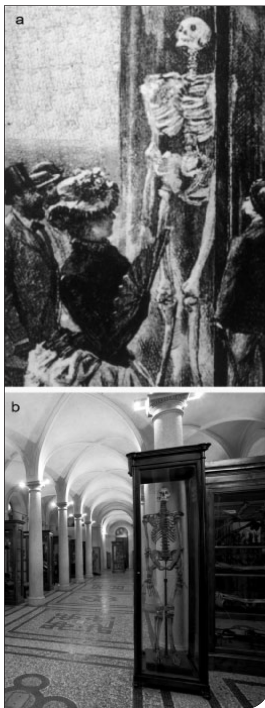
Fig. 3. a) E. Matania, "Nelle sale d'Antropologia", in "Torino e l'Esposizione Italiana", 37, Torino - Milano, 1884. Particolare dell'illustrazione raffigurante lo scheletro del gigante appartenente al Museo di Anatomia di Torino. b) Lo scheletro del gigante ora esposto in Museo. a) E. Matania, "Nelle sale d'Antropologia", in "Torino e l'Esposizione Italiana", 37, Torino - Milano, 1884. Detail of the illustration of the skeleton of the giant belonging to the Museum of Human Anatomy of Turin. b) The skeleton of the giant displayed in the museum today.

Il secondo dopoguerra vede momenti di rilancio di alcuni musei scientifici torinesi, che per alcuni anni divengono fruibili: è il caso del Museo di Zoologia e di quelli di Mineralogia e di Antropologia ed Etnografia. Nel 1961 la creazione del ruolo dei Conservatori dei Musei e dei Curatori degli orti botanici (legge 3 novembre 1961, n. 1255), aventi come compito la conservazione e l'incremento delle collezioni scientifiche, sembra segnalare l'inizio di un periodo di rinnovato interesse per le collezioni universitarie, ma non corrisponde in seguito a concrete azioni a favore dei musei. Come è noto, infatti, Il D.P.C.M. 24 settembre 1980, emanato a seguito della legge 11 luglio 1980, n. 312 che istituiva una nuova classificazione dei ruoli del personale tecnico e amministrativo suddiviso per qualifiche funzionali,