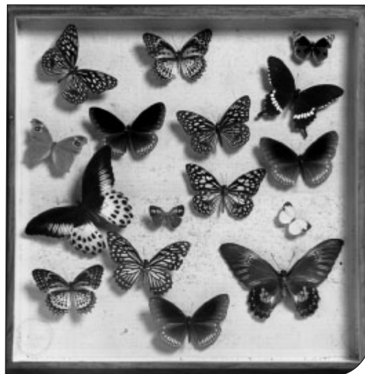
Fig. 6. Lepidotteri esotici, inizi del XX secolo.

Still in Turin, the handwritten inventories of the ancient Museum of Zoology ("Numerical Catalogue of the vertebrate animals of the R. Museum started in 1820 - finished in 9bre 1827. N.1-3760 and List of the Donations and Register of the Received shipments", conserved in the archive of the present-day Department of Life Sciences and Systems Biology) are a valuable source of this type of information, relating to objects still existing but sometimes lost. For example, we can no longer identify the "Leopard in the pose of seizing a cat that vainly tries to defend itself. The individual was sent as a Gift to King Victor Amadeus III from the emperor of Morocco, as a peculiarity on